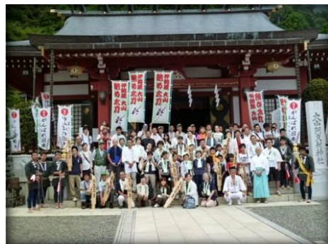
小学生から大人まで、だれでも参加できます！

山頂までの登拜が許される夏山(旧暦6月27日~7月17日)にはたくさんの参詣があり、浮世絵には木太刀を担いで東海道を往來する人々の姿が描かれ、木太刀と夏山は川柳にも詠まれています。